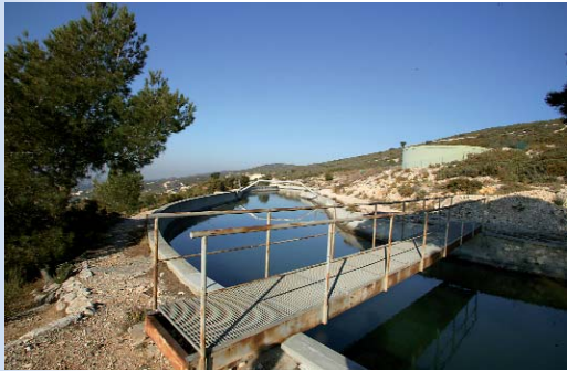
Le canal de Marseille, paisible en apparence