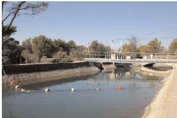
Ligne de vie flottante