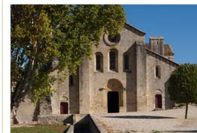
Abbaye de Silvacane 13640 La Roque d'Anthéron