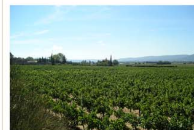
Vignobles Forbin de Janson 84530 Villelaure