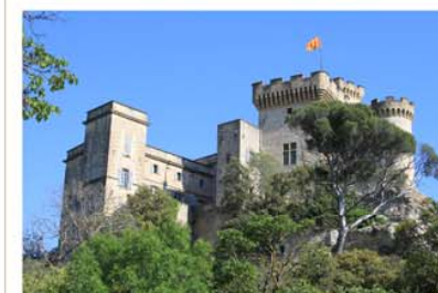
Château de La Barben 13330 La Barben